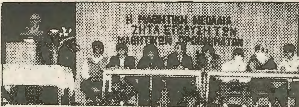
Το προεδρείο του συνεδρίου. Ο αγώνας για τον συνδικαλισμο ξεκίνησε. Το μαθητικό κίνημα χρειάζεται ηγεσία που να μπορεί να πολιτικοποιήσει τον αγώνα.

Στην Λάρνακα οι μαθητες πάλεψαν με το κράτος και κέρδισαν μια πρώτη μάχη. Το υπουργείο ανέχτηκε τελικά το συνέδριο. Απο αψη την άποψη αποτελεί σταθμο στην ανάπτυξη του μαθητικού κινήματος. Απο την άλλη όμως μπορεί να δώσει την αίσθηση της αφο-